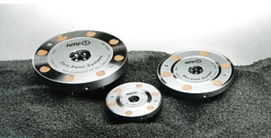
Mit AMF-Nullpunktspanntechnik lässt sich der Fertigungsverfahren im 3D-Druck mitsamt den anschließenden Folgeprozessen hochgradig standardisieren.

heit und Wiederholgenauigkeit nicht leiden. Deshalb hat AMF für diese besonderen Herausforderungen auch besondere Spannmodule entwickelt.