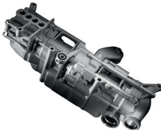
Gespannt werden die Rohteile in der AMF-Vorrichtung hydraulisch mit maximal 190 bar Druck.