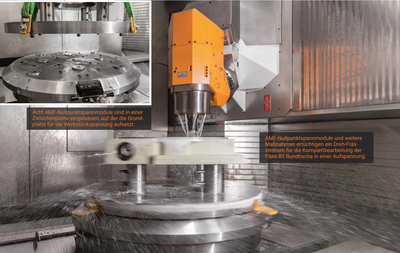
AMF-Nullpunktspannmodule und weitere Maßnahmen ertüchtigen ein Dreh-Fräszentrum für die Komplettbearbeitung der Fibro RT Rundtische in einer Aufspannung.

Als es bei Fibro RT darum ging, eine alte Karusselldrehmaschine zu ersetzen, sollte dies nicht 1:1 geschehen. So schafft jetzt ein neues Dreh-Fräszentrum die benötigten Voraussetzungen und Kapazitäten zur Komplettbearbeitung der vielfältigen Rundtische. Für die Fertigung der oft kundenspezifischen Rundtische ‚pulverisieren‘ ergänzende Nullpunktspannsysteme von AMF geradezu die Spannvorgänge und Rüstzeiten. Die Laufzeiten der Maschine werden zudem durch kompetente Programmierung bestens ausgereizt. Von solchen Lösungen profitiert sogar die Erforschung des Weltraums.