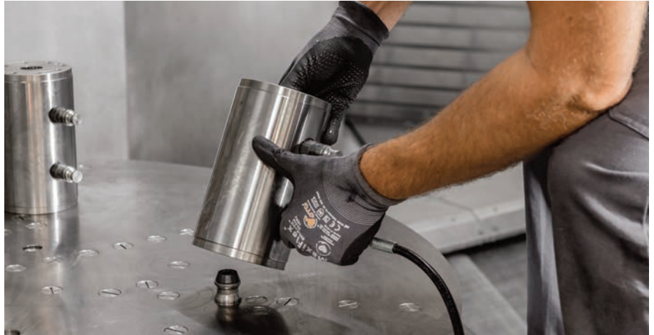
Mit beidseitig bestückten AMF-Nullpunktspannmodulen schaffen Spannkonsole die nötige Distanz zur Grundplatte für eine 5-Seiten-Bearbeitung.

tätssteigerung heben können, um weiterhin wettbewerbsfähig zu sein.“ Die Abnahme beim Maschinenhersteller Reiden gleich einem Schaulaufen mit viel Lob für das „sehr gut vorbereitete Fibro RT-Team.“