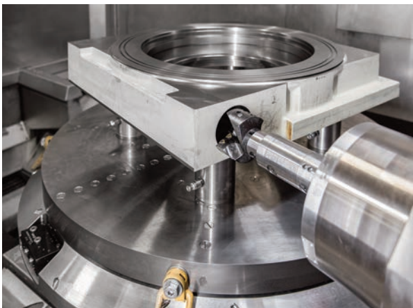
Durch nur noch eine Aufspannung erhöht sich die Präzision, die Fibro RT in drei Ebenen benötigt: Ober- und Unterseite sowie koaxial für die Schneckengetriebe.

Werner schwört auf das Potenzial, das in der Dreh-Fräsbearbeitung auf einer einzigen Maschine steckt. „Da steckt noch viel Produktivität drin, die wir nach und nach noch ausschöpfen werden.“ Und da meint der erfahrene Experte nicht nur die Anzahl der Spannvorgänge und die Zeitersparnis. Vor allem geht es ihm auch um die Präzision, wenn er betont, „dass die Genauigkeit größer ist, wenn nur einmal gespannt wird. Dazu gehört auch, dass wir weniger Spannungen im Teil haben, die später wieder größere Toleranzen erfordern.“ Werner blickt dabei auch über den Tellerrand der Bearbeitung hinaus. „Wir müssen mit einer Fertigung in Deutschland stets daran denken, wie wir alle Potenziale zur Produktivität